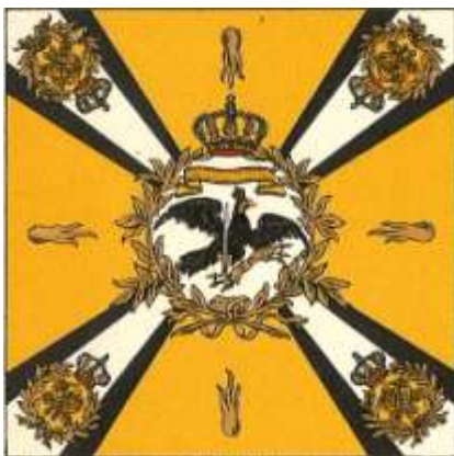
Abbildung 3 Regimentsfahne des IR 128: Quelle: Wikipedia.de aus: Martin Lezius: Fahnen und Standarten der alten preußischen Armee.; Stuttgart 1935, Franckh'sche Verlagsbuchhandlung

Kurz nach der Mobilmachung am 2. August 1914 muss er in Rees beim Photographen Knippenberg erschienen sein um dort das abgebildete Foto aufnehmen zu lassen.